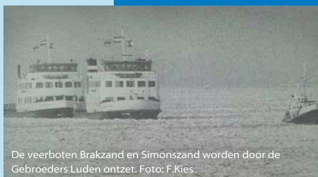
De veerboten Brakzand en Simonszand worden door de Gebroeders Luden ontzet.