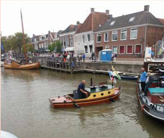
Assistentie bij het aanmeren

Elk jaar zie je dat de Admiraliteitsdagen van een nog hoger niveau worden. En dit jaar speelde absoluut mee dat het prachtig weer was. Van vrijdag 5 tot zondagmiddag 7 september was Dokkum het bruisende toneel van vele activiteiten. Ook dit jaar werden wij als Gebroeders Luden weer gevraagd om hierbij aanwezig te zijn en met ons schip te komen pronken. En dat doen wij natuurlijk erg graag!!