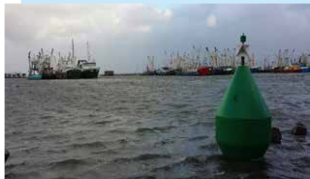
De boei markeert onze parkeerplaats