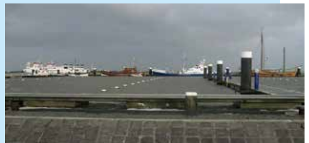
De koppen van de meerpalen staan nog net boven water.

Op 22 oktober j.l. was het mede door de NW-storm extreem hoogwater op Lauwersoog. Onze boei stond in z'n element maar binnen bleef het gelukkig droog.