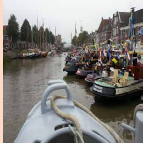
Het was druk in het Grootdiep

een prachtig historisch sleepbootje kwamen we keurig op de plaats van bestemming. Prachtig om onderdeel te mogen zijn bij de presentatie van alle hulpdiensten die Nederland zo'n beetje rijk is. Van marine tot brandweer, allemaal zorgden ze voor, het voor het publiek zo boeiende, spektakel