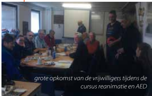
grote opkomst van de vrijwilligers tijdens de cursus reanimatie en AED

In de Stuurhut werd gedurende de winter een cursus vaarbewijs I en II gegeven door onze vrijwilliger Oomke Bos aan onze eigen vrijwilligers